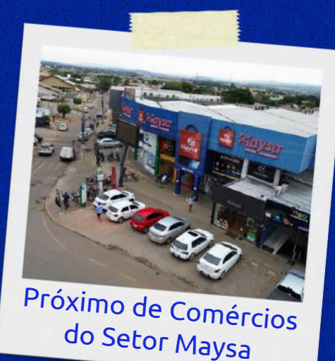
Próximo de Comércio do Setor Maysa