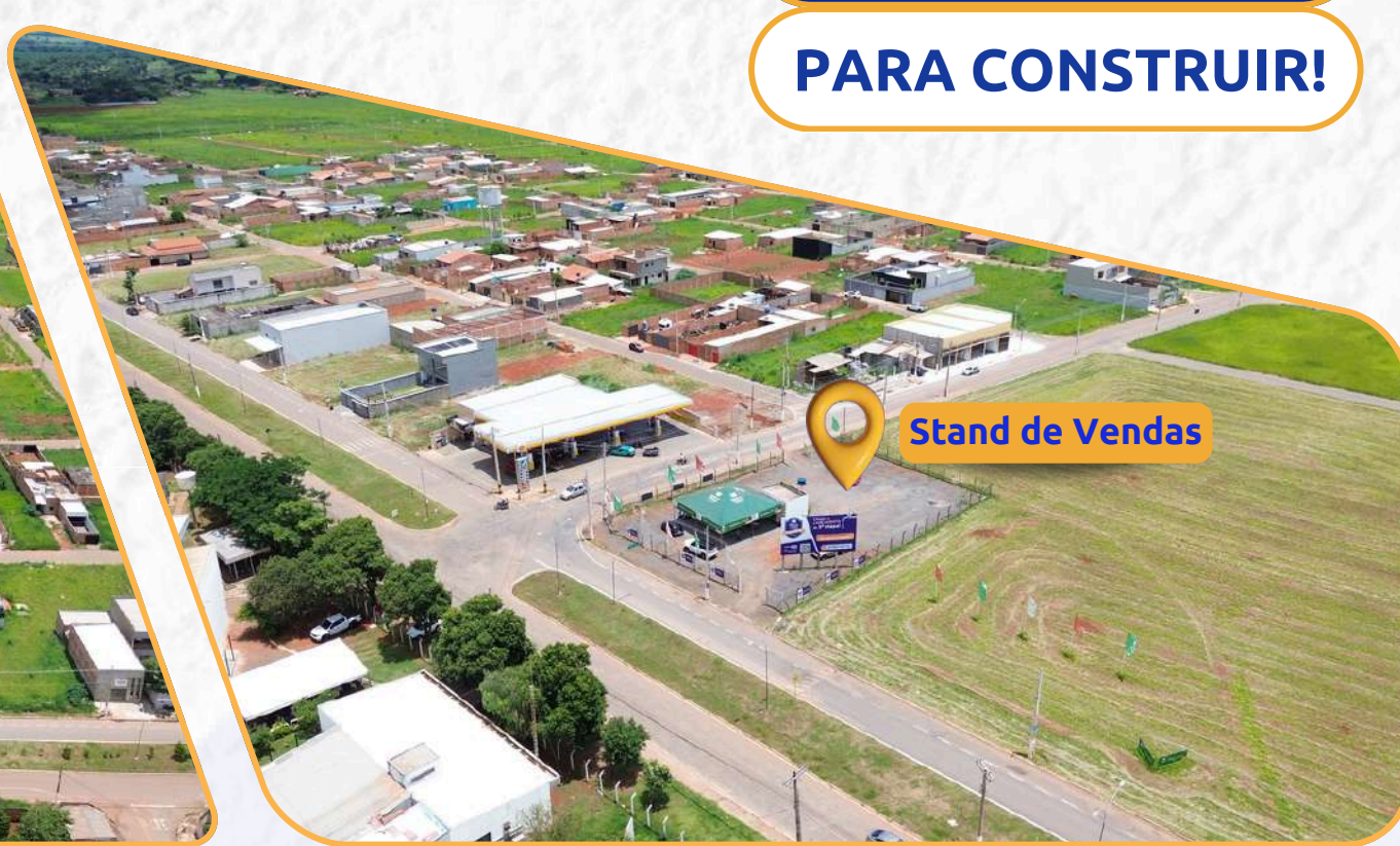
Stand de Vendas