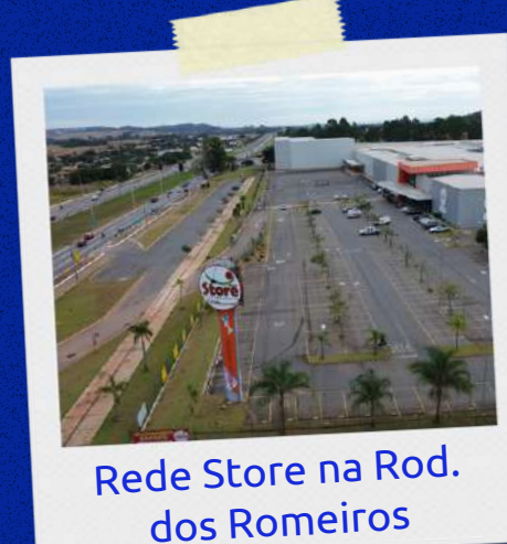
Rede Store na Rod. dos Romeiros